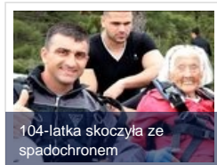
104-lątka skoczyła ze spadochronem

Niebieskoocy najrzadziej mają na skórze białe plamy, natomiast osoby o brązowych oczach są najmniej narażone na najgroźniejszy nowotwór skóry - czerniaka - informuje "Nature Genetics".