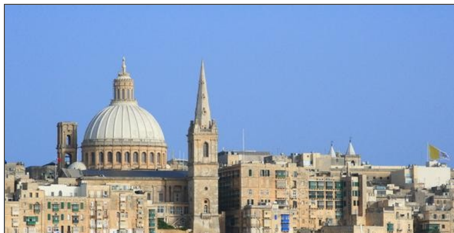
Tagi: turystyka językowa kursy językowe kursy językowe